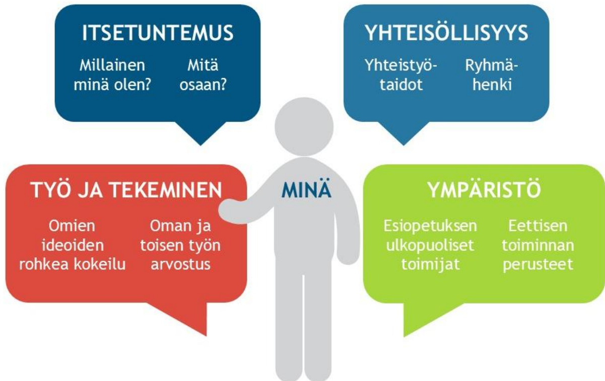
KUVIO Yrittäjämäinen toimintatapa

Yrittäjämäinen toimintatapa on ennen kaikkea asenne ja toimintatapa, jota tarvitaan elämässä, opiskelussa ja tulevassa työssä.