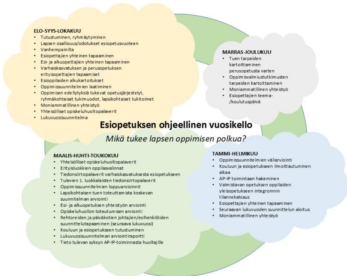
KUVIO Esiopetuksen ohjeellinen vuosikello

Lapsen siirtyminen esiopetuksesta koulun on joustava ja sujuva jatkumo. Onnistunut siirtyminen tukee hyvinvointia, lapsen sosiaalista sopeutumista ja kiinnittymisen tunnetta oppimisympäristöönsä. Lapsen ja huoltajien osallisuus huomioidaan siirtymäkäytännöissä. Lapsi ja huoltajat tuottavat erilaista tietoa kuin esiopetuksen ja koulun ammattilaiset. Kaikkien tieto on yhtä arvokasta.